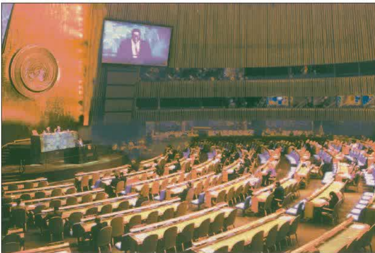
Một phiên họp của Đại hội đồng Liên