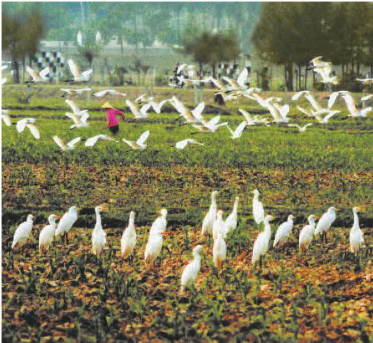
Miền quê thanh bình