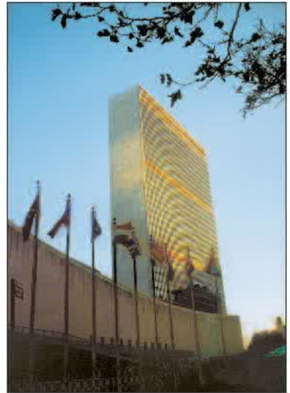
Trụ sở Liên hợp quốc tại Niu Oóc (Hoa Kỳ)

Công ước Quốc tế về Quyền trẻ em đã được Liên hợp quốc thông qua ngày 20 tháng 11 năm 1989.