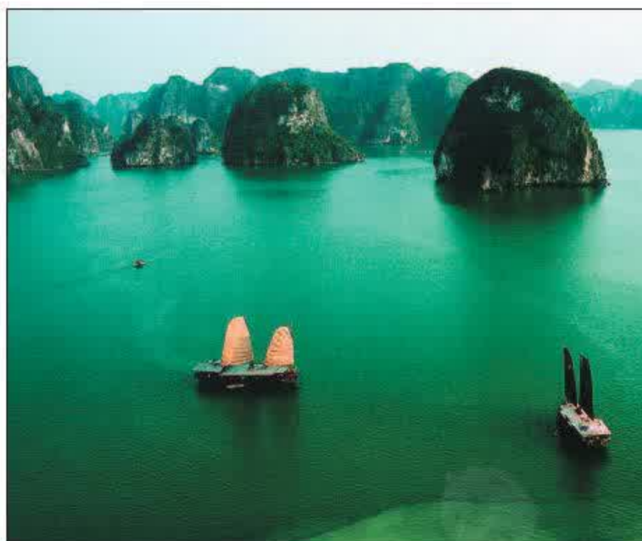
Vịnh Hạ Long