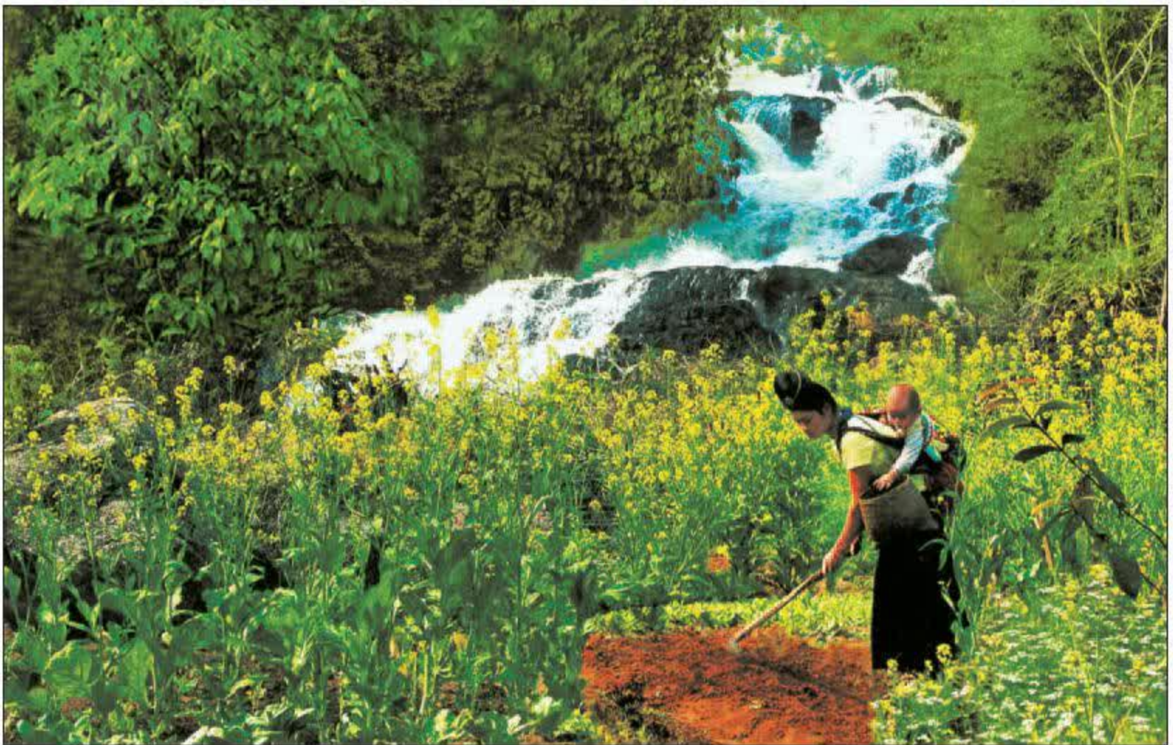
Mẹ địu con / m nông