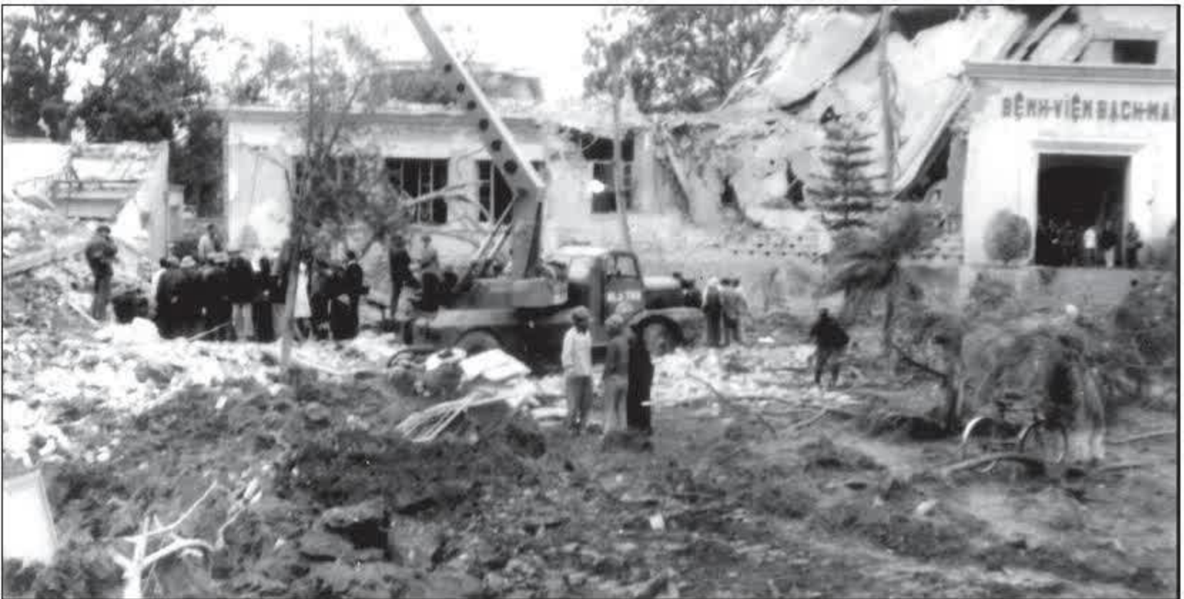
Bệnh viện Bạch Mai (Hà Nội) bị máy bay Mỹ ném bom ngày 26 tháng 12 năm 1972