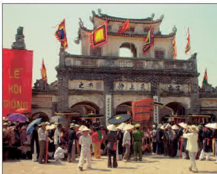
Lễ hội Đền Gióng (Phù Đổng, Gia Lâm, H Nội.)

- Tính đến năm 2005, Việt Nam có Vịnh Hạ Long, Cố đô Huế, Phố cổ Hội An, Di tích Mỹ Sơn, Vườn quốc gia Phong Nha - Kẻ Bàng, Nhã nhạc cung đình Huế, Không gian văn hoá công viên Tây Nguyên đã được UNESCO công nhận là di sản thế giới.