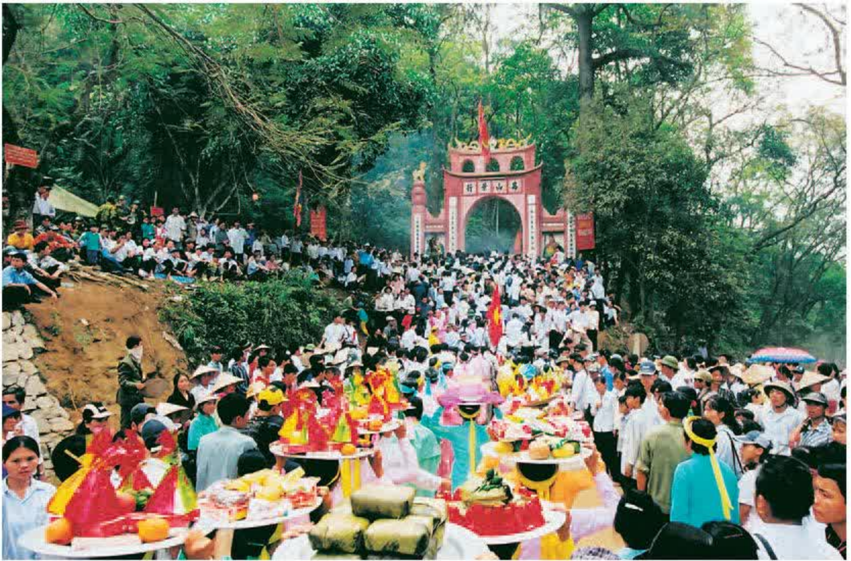
Giỗ Tổ Hùng Vương